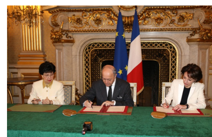
Dr Margaret Chan , Directeur général de l'OMS, Mr Laurent Fabius , Ministre des Affaires étrangères Mme Marisol Touraine , Ministre des Affaires sociales et de la Santé, 2 décembre 2013